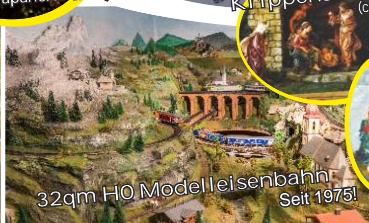
32qm HO Modelleisenbahn Seit 1975!