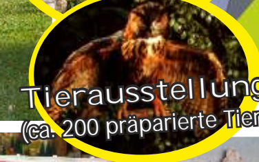
Tierausstellung (ca. 200 präparierte Tiere)