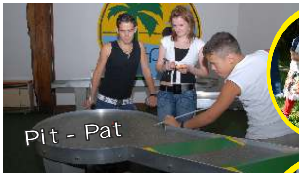
Pit - Pat

Der kleine gemütliche Park im Schwarzwald.